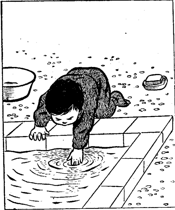
(五) 幼童在水池邊遊戲，小心跌落池內！