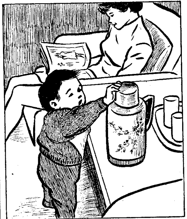
(四) 萬一熱水瓶翻在身上，滾燙的開水，燙傷了，有性命危險！