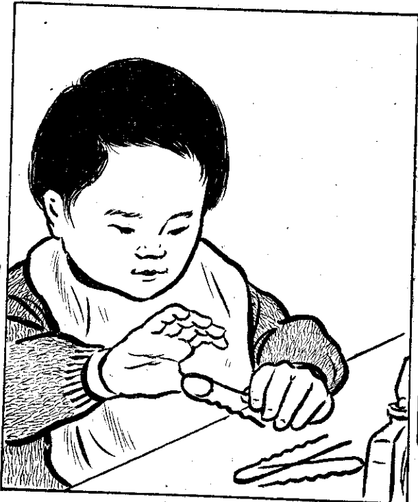
(二) 媽媽的頭髮夾子，夾在手指上玩，一個不小心，可能皮破血流。