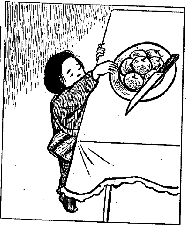
(一) 水果盤上放一把水果刀，打翻了，說不定掉在孩子頭上，危險！