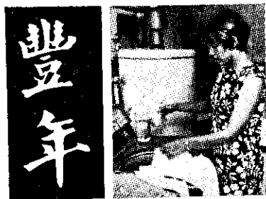
"Chinese Edition" of Iowa Farm Science - see p.2

Iowa State University of Science and Technology / Ames, Iowa