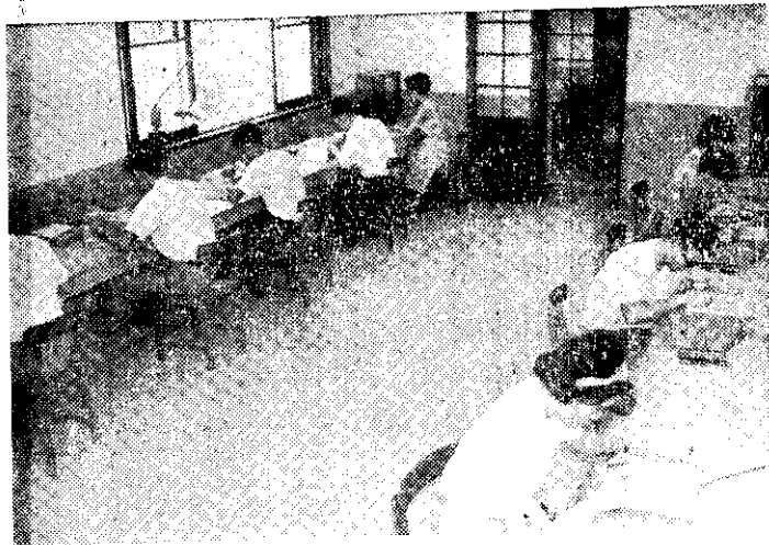
農林廳種子檢查室工作人員辦理種子檢查