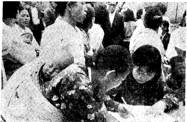
家庭計畫門診部將每位母親的案情做成記錄

過男性結紮手術訓練，一、〇〇〇位醫師受過子宮內避孕裝置訓練。對於偏遠地區，更設有巡迴門診，這種門診除提供民衆節育的服務外，也用來訓練鄉村醫師們避孕的各種技術。 自從一九六四年，全國性家庭計畫工作推廣以來，已有衆多的民衆實行，這些人都是屬於較易接受的羣。今後韓國的家庭計畫，如期能影響人口的增長率，其對象必將針對尚未實行的一羣，這種努力將倍艱以往。韓國計畫在今年中成立三〇〇個鄉鎮衛生所。過去一向強調小家庭的種種益處的大衆傳播，今後也將集中精力，向民衆報導如何及何處可獲得避孕服務的消息。 韓國的家庭計畫工作，是屬於社會保健部，該部的預算僅占政府總預算的一分。他們推行家庭計