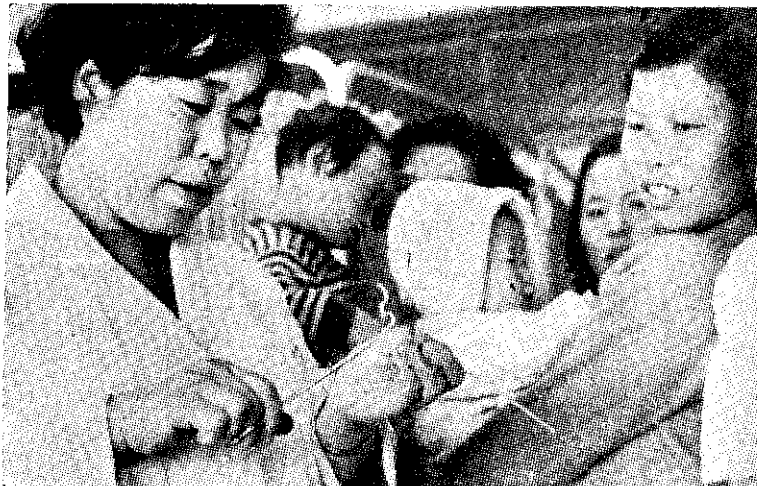
韓國家庭計畫工作人員正爲母親們講解子宮內避孕器——樂普

母親會的會員，每個月都會接到一本叫做「模範家庭」的雜誌，內容涉及營養、農業及家庭計畫。婦女們一旦參加母親會，很快地就成爲鄰里主要散布消息的來源，她們都主動地將從母親會所學的告知鄰居或親朋。 節育的服務在韓國也非常普遍，每個縣市衛生局都設有門診部爲民衆服務。另有七〇〇位醫師受