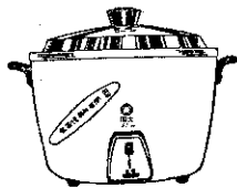
TAC-8H 型 大同保溫電鍋