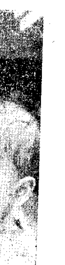
一位尼泊爾婦女和他的孩子，在等待家庭計畫門診服務。

摯的說：「那正是適合於我使用的方法」，他附加說明：「我已經有太多的孩子」，並伸出他的手指表示他有七個孩子。