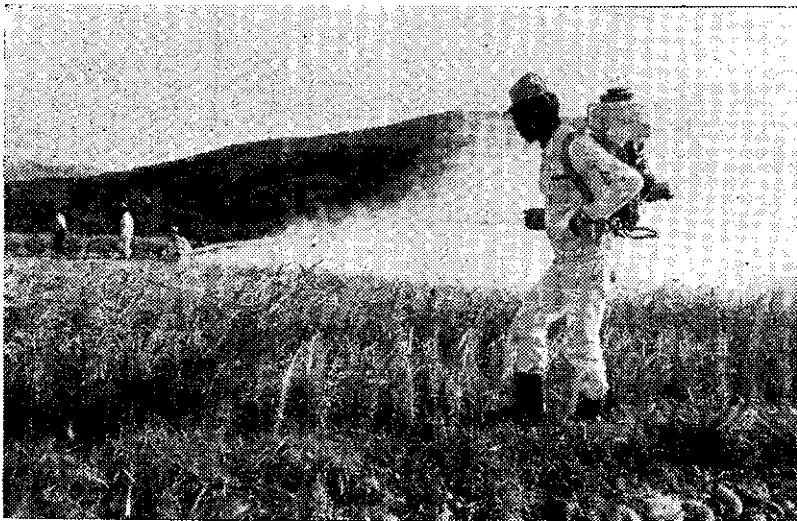
農民應用新式高壓噴藥機 (林吉郎)

水果：目前種類以香蕉、鳳梨、柑桔、葡萄、芒果及荔枝為主。香蕉在日本市場遭遇的困難日多，仍以品質不佳，數量不穩定，無法在國際市