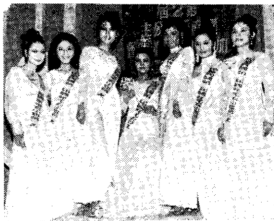
第三屆毛衣公主加冕

此次調整的重點，在於縮短存放款利率的差距，同時為了兼顧鼓勵儲蓄，在存放款利率普遍降低中，只有一年期以上儲存利率不變。中央銀行宣布的新利率如