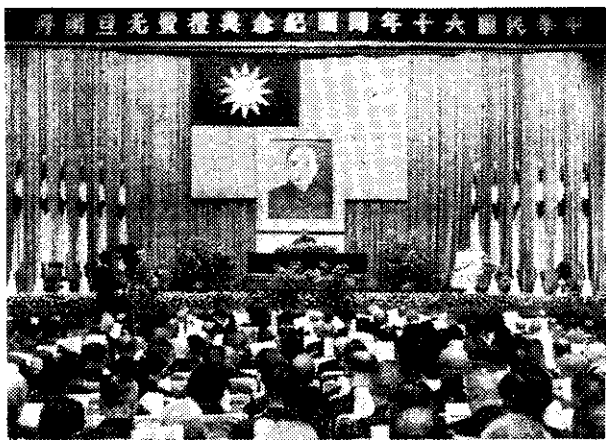
蔣總統主持開國六十年紀念典禮

經濟部對於本年度的經濟發展策略與方向，將在維持物價穩定的原則下，謀求經濟快速發展，並力求農工業配合生