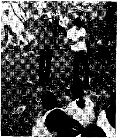
下—草屯公園裡猜迷遊戲(張光宏)