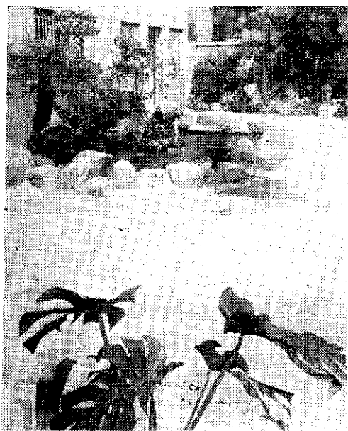
— 保成 —