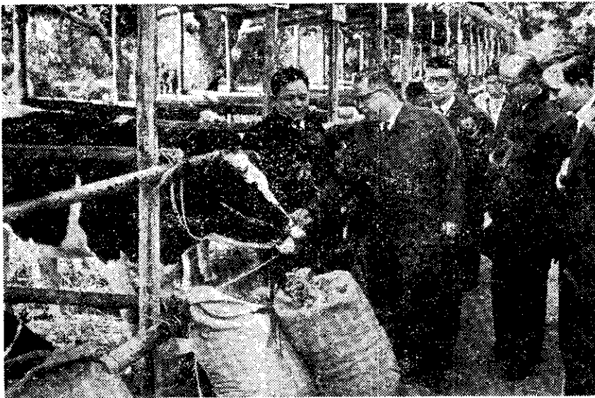
本文作者(左)在乳牛競賽會場中(林吉耶)

台灣的乳牛事業，一直到最近才見好轉。彰化酪農鮮奶加工廠最初成立的幾年，原就沒有打算馬上賺錢。幸好從去年(五九)開始，鮮奶的銷路打開了，銷售量增加了一倍，業務也就慢慢的開展了。