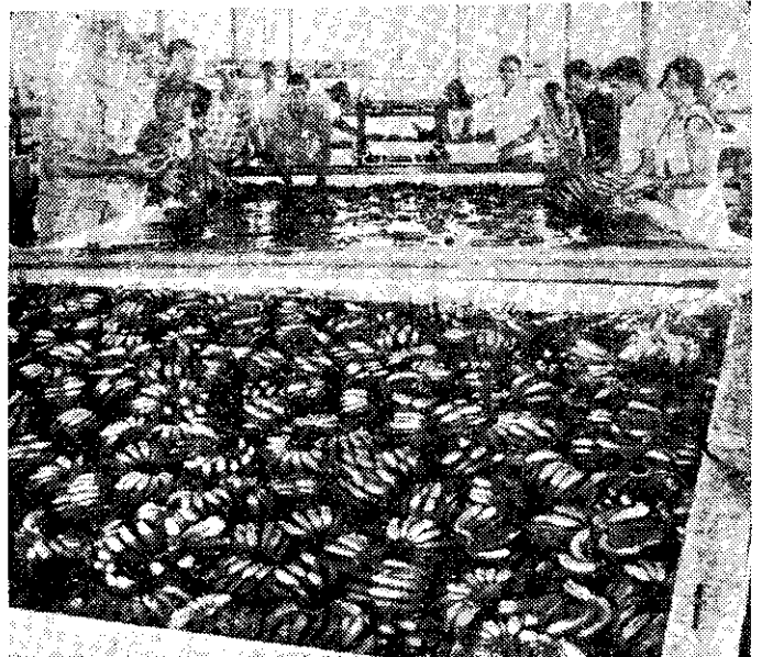
香蕉包裝前用溫水洗淨

他們採用紙箱包裝。紙箱是日本進口，對於表面壓力抵抗良好，腐損碰傷率也因此降低。每個紙箱可以裝入十二公斤的香蕉。據該公司發表，每星期可以包裝十五萬四千箱香