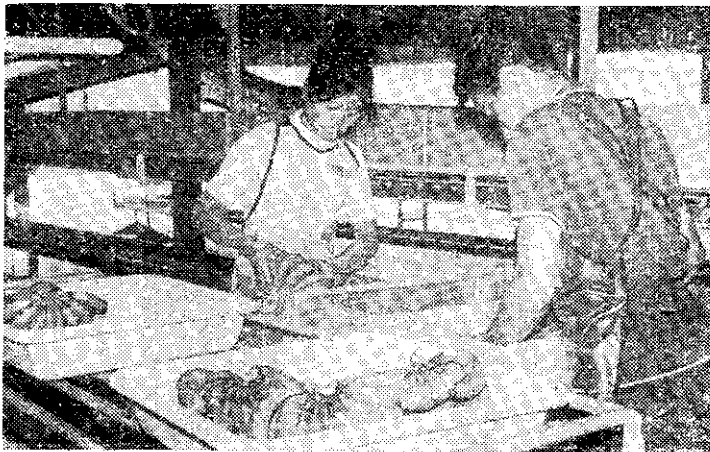
香蕉裝箱前，先用塑膠袋包裝。

由於栽培面積大，該公司採取一貫作業方式，全部作業程序包括整地、種植、空中噴藥、採收、分級包裝與品質管制。除了用機械耕作以外(公司設有農機具修護保養場)，並僱有工人一千餘名，進行種植、除草及管理工作。公司設有研究發展中心，聘請外國專家分別研究病虫害