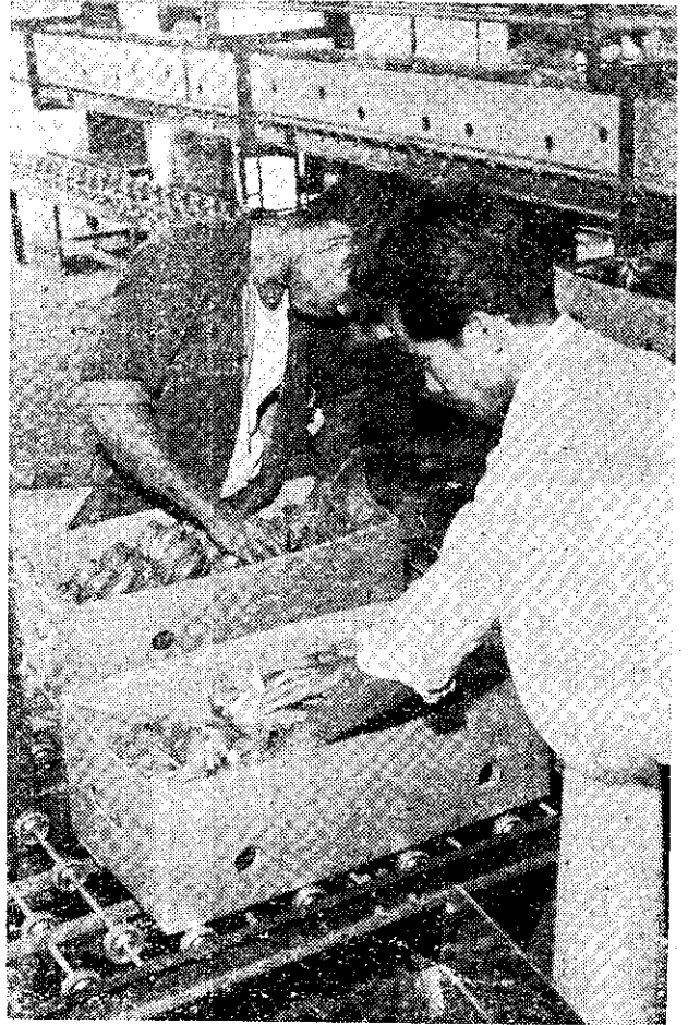
香蕉紙箱包裝，每箱12公斤。