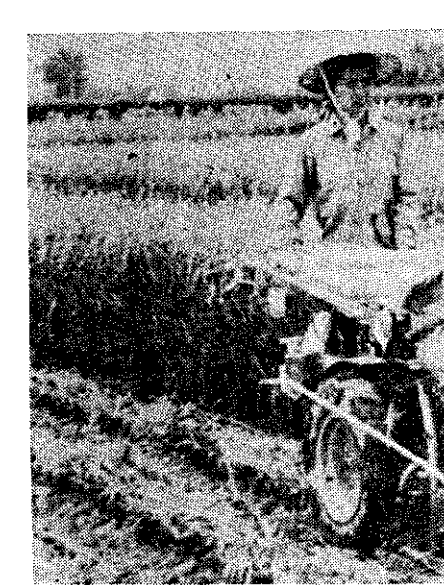
潮州水稻一貫作業機械化實驗區開始收成

酪農發展專業貸款 農復會指出：台灣的酪農多期待公營金融機構給予專業貸款，同時也希望能夠簡化不動產抵押辦法，放寬農民的信用。