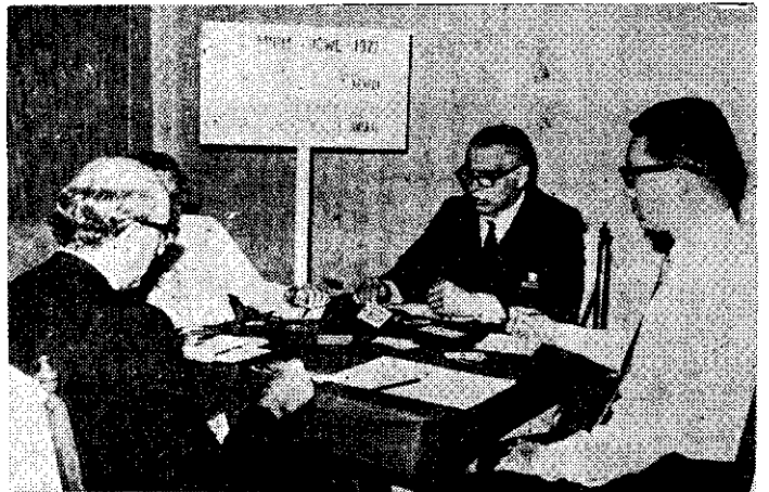
百慕達杯世界橋藝大賽在台北舉行

這項勸導取銷工作，有兩項與往年不同的措施：(一)不論遊行人數多少，絕對禁止在祭典日迎神遊行。(二)凡發現祭典日宴客，有鋪張浪費情事者，