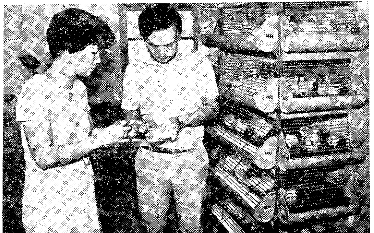
小雞打預防針 (林吉那)