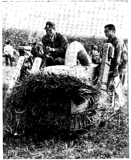
水稻聯合收穫機田間作業 (林吉郎)