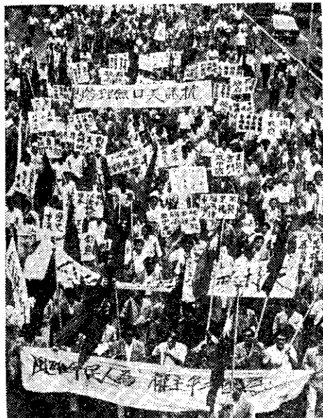
台大學生維護釣魚台主權示威遊行 (中六社)

根據最近政府有關單位，及研究機構專家們的一項綜合性調查報告顯示，台灣地區水源污染情形日趨嚴重，其中台北盆地的基隆河、新店溪更是嚴重，影響國民健康很大。