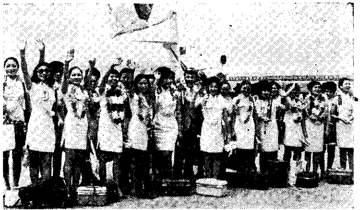
中華兒女藝術團飛往東南亞旅行演唱

是「戰爭與人」。亞洲製片人協會，已決定明年的第十八屆亞洲影展，由韓國主辦，暫定以「只展覽，不競賽」的方式舉行。