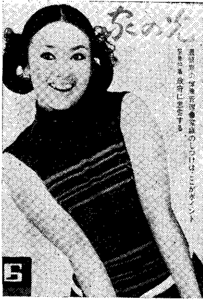
我旅日影星翁倩玉出現在日本農業雜誌「家之光」的封面。