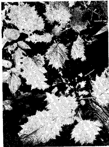
滿生刺毛的咬人貓

黃的着色促進劑混合使用，很是便利。 使用方法是，「托布仁」稀釋一、〇〇〇倍，在收穫前噴施。「便利多」稀釋二、〇〇〇倍，在收穫前七天噴施。 但是這兩種藥劑，並不能防治黑腐病。 （啟敏取材自「農耕と園藝」一九七一年七月號）