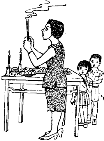
清香水果，拜拜最好。

我們研究這些習俗的來源，當初都有很好的意思。無非教育子弟們懷念祖先，施捨貧困，報答父母養育之恩，並有提倡體育及戶外活動的意義。如果大拜拜只是請了許多人大吃大喝，浪費金錢，甚至引起醉酒爭吵，那就失去原來的意義了。祭祀祖先，只求心誠，清香水果，最爲適當。