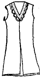
矮胖型(上期此圖說明錯誤，請改正)