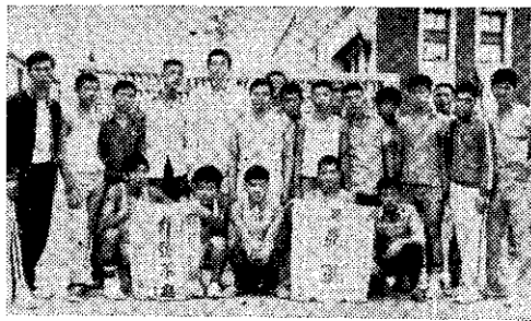
景美區四健會在區運會中獲得豐碩的成果(高福來)

第二組：南縣、屏縣、嘉縣、中市、南市、北縣。 第三組：投縣、中縣、高縣、宜縣、東縣、苗縣。(王琮苑)