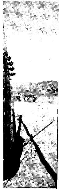
日月潭慈恩塔 — 張榕振