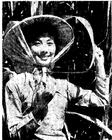
孩子少，太太永遠年青漂亮

林：三十一歲。 工作人員：那你先生呢？ 林：三十七歲。 工作人員：你使用什麼方法避孕？ 林：我裝置樂普。 工作人員：你使用多久了？ 林：在老二滿兩個月時就裝了，她現在七歲。 工作人員：喔！你已裝置七年了，一直使用它？ 林：是的，從沒改用過任何其他方法。