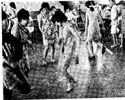
——北市家政班員康樂表演(馮)