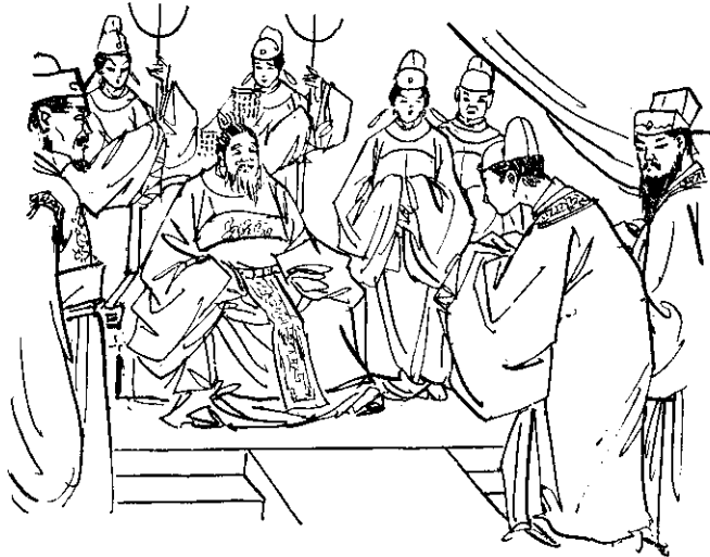
于純趕緊恭恭敬敬的行了三鞠躬禮

俗話說：三年河東，三年河西，世事常是變化不定。柏州府的東邊有個野心的迷人國，地狹人多，生活困難，野心却很大。看到柏州府的富足，便出兵來侵犯，于純就命老周帶兵去抵抗。