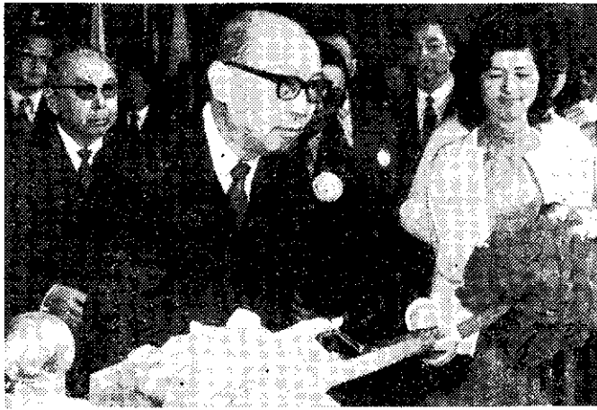
嚴副總統為中華文化復興展覽剪綵

泰國的部分反對派的國會議員，親共政客及少數軍警官員，陰謀發動政變，以推翻反共強人他儂總理領導的現政府。此一陰謀幸被發覺，已告失敗。