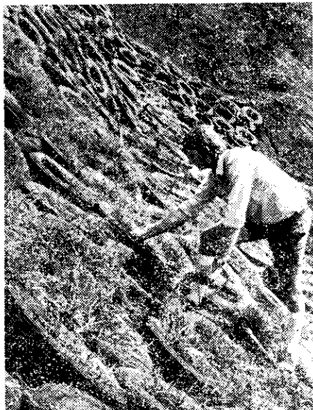
——澳洲採用舊輪胎防止土壤沖蝕——

預定名額三千人，其中台北市一千人，外縣市二千人。每人每月報酬約一千元。凡三專以上日間部在學青