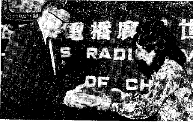
世界民俗藝術觀摩會中教育部長頒發紀念狀

據民航局官員說，這次班機失事，迄今未尋獲機上的引擎，或重要儀表，因此鑑定失事原因很困難。