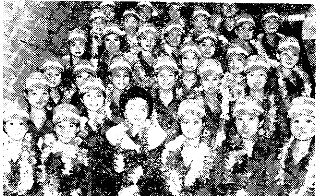
藝霞歌舞團赴東南亞各國公演(中央社)