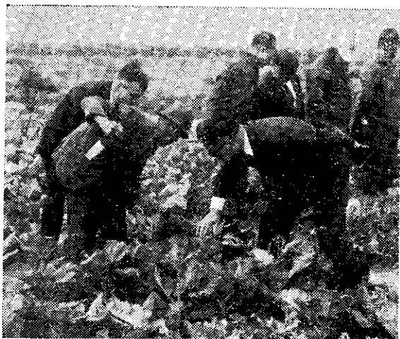
會摩觀防治綜合害虫蔬菜橋板

該場與台灣肥料公司合作推行的複合肥料示範及施肥益效競賽計畫，輔導茶農革新施肥方式及獎勵增產嫩採已見實效。