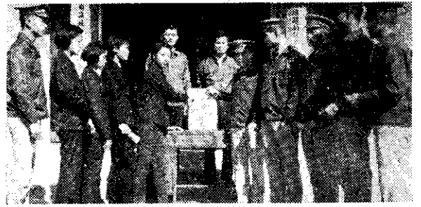
北門農職愛國捐款(百心)