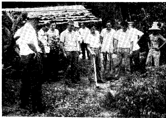
綜合發展示範農戶試用火燭消毒器