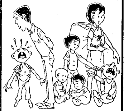
王家夫婦 孩子太多 生活痛苦