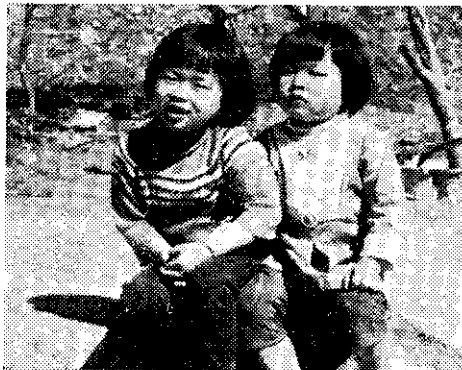
兩個孩子足夠了(呂福和)

「子女少，幸福多少，幸福多少」是句現代名言。爲獲得真正的幸福快樂，最好是生養兩個孩子，才能和子女享受天倫之樂，這才是真正的幸福家庭！