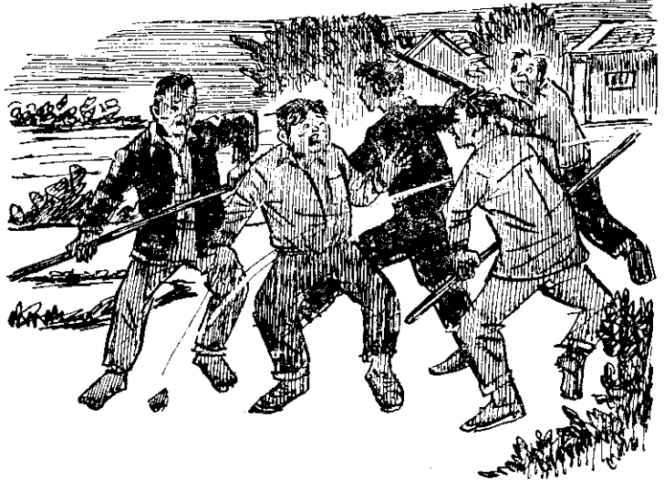
黑暗中，一場捉賊的混戰。

黑影，正擋住那兩個傢伙的去路。你道是誰，原來正是父親，手中還拿著一根扁担作為武器。 那兩個傢伙好像要跟父親拼一下，迅速的分開站立兩旁。這時，我們弟兄三人也已趕到了。 說時遲，那時快，那矮胖的傢伙突然丟下手中的雞，由地上拾起一塊大石頭。 幸得大哥眼明手快，「碰」的一棍，不偏不倚的打在那傢伙的手上，石塊也隨著掉下來。 「劈！」父親也乘機給那高瘦的傢伙一扁担，因為他正舉腳想踢二哥。這時，我也毫不客氣的跑上去給那高瘦的傢伙一拳。 賊人一看局勢不好，也顧不了偷到手的雞，急忙逃跑。 只見二哥一個箭步，飛腿踢在後面矮胖的屁股上。二哥在學校裡，原就是足球健將。賊人抱頭鼠竄，奔向黑暗中。 「追！」大哥大聲的喊。 「不行！」父親立刻制止我們的行動，然後說：「窮寇莫追，現在形成敵暗我明的形勢，那是非常危險的。」