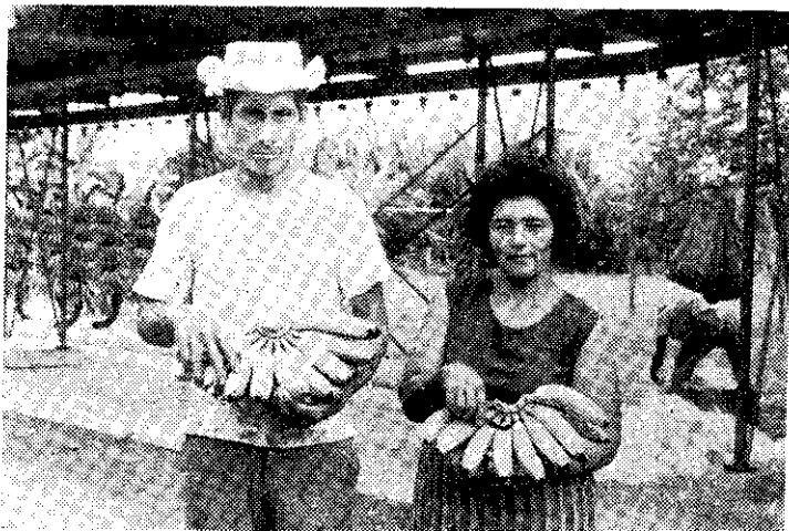
巴拿馬香蕉採用圓形割軸（蘇朝鴻）

然而，中南美與菲律賓香蕉生產者，也在致力改進他們產品的風味，同時更進一步提高整齊畫一