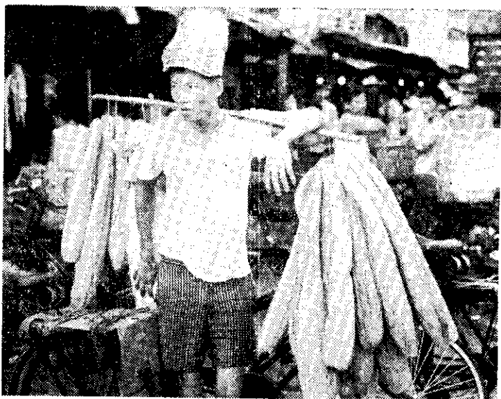
台北街頭賣絲瓜筋的小販