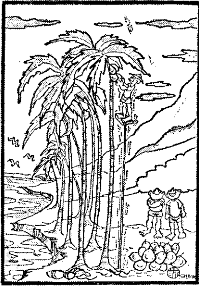
我特地聘請了這位特技演員來摘椰子(聰賢)