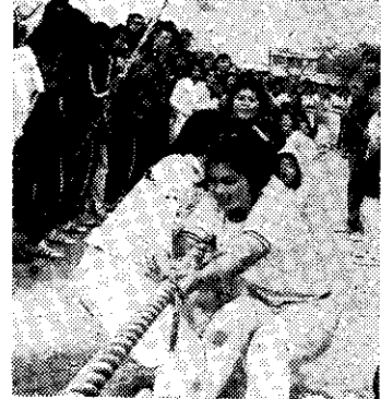
豐商校選拔河比賽(珍)

▽省立台中農校二年級同學，為加強課外育樂活動，新近成立三個社團：橋藝、園藝及土風舞三個研究班。 活動時間暫定於每星期六及假日，並由老師予以輔導，參加同學甚為踴躍。(黃海)