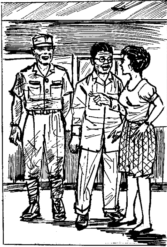
爸，我和阿兵哥一同挖水溝去！