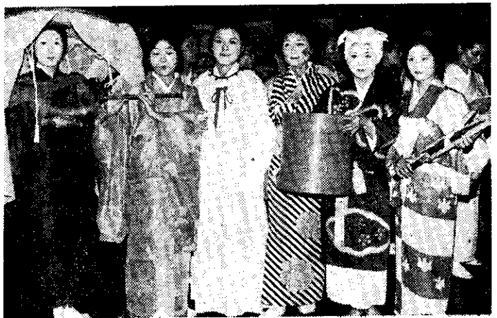
中日歷代服裝樂舞表演