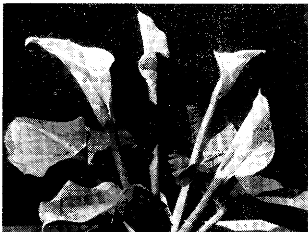
海芋花盛開 (呂福和)