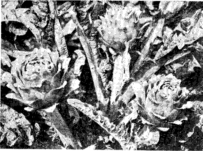
——朝鮮薊的肉質花蕾（呂福和）——