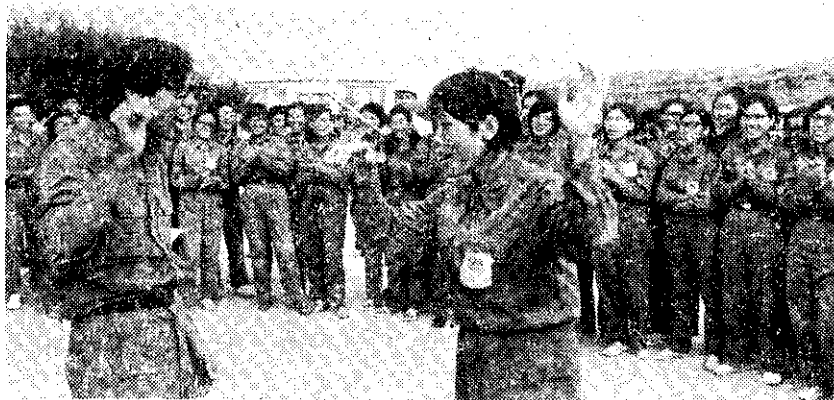
暑期自強活動學員演歌劇