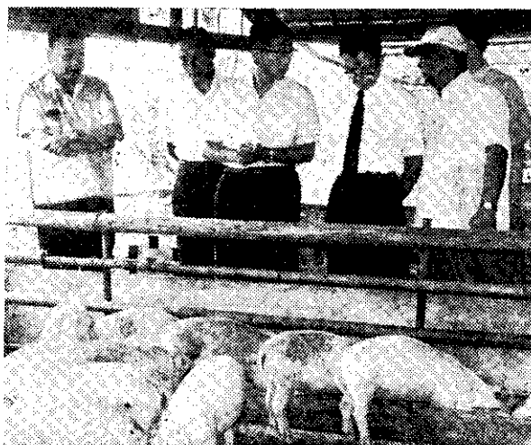
——省府主席謝東閔(左)參觀綜合養豬——(中央社)——