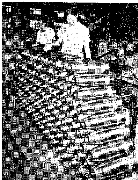
——國軍聯勤光華廠裝配彈藥——

有關方面反映說：各級政府機關、學校、團體，對人民遺失有關證件，如學生証、公車票、服務証、駕駛執照等，申請補發時，均規定須登報三日，使申請補發者至感不便。而遺失身分證之登報規定，早經廢止，故其他證件也應廢止其必須登報的規定，僅須取得相當人員證明，即可申請補發。