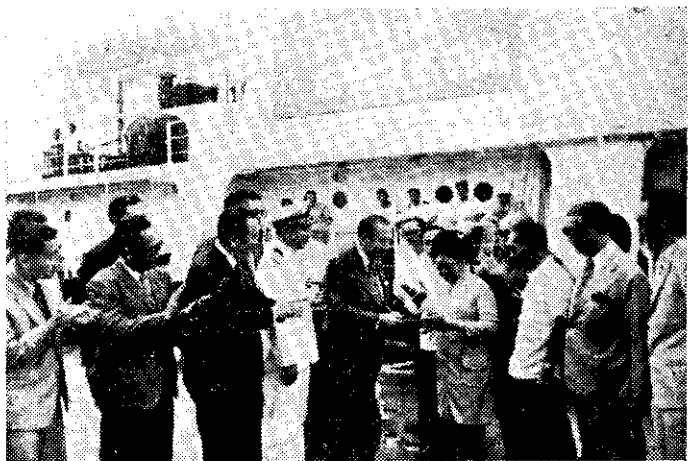
——我國送給菲律賓救濟品在馬尼拉移交(中央社)——