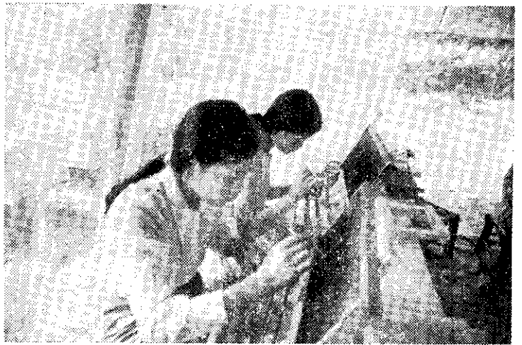
移虫（將巢脾中的蜜蜂幼虫用羽毛移至人造假王台裡）

蜂農將移有幼虫的人造假王台框，置入蜂羣，經二或三天後，有些蜂農在樹蔭下就地設置帳篷、紗網並在舖有草蓆情形下，收取蜂皇漿。有些蜂農則用機器腳踏車載着放有冰塊的箱子，到蜂場中將已有蜂皇漿的人造假王台連框從蜂箱中取出，立即放入此箱子裡，等收集到一定的數量後，即載回家裡在裝有紗窗、紗門的房內收取蜂皇漿。