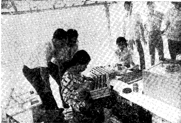
刮取蜂皇漿(將人造假王台裡的蜂皇漿用竹片刮取)