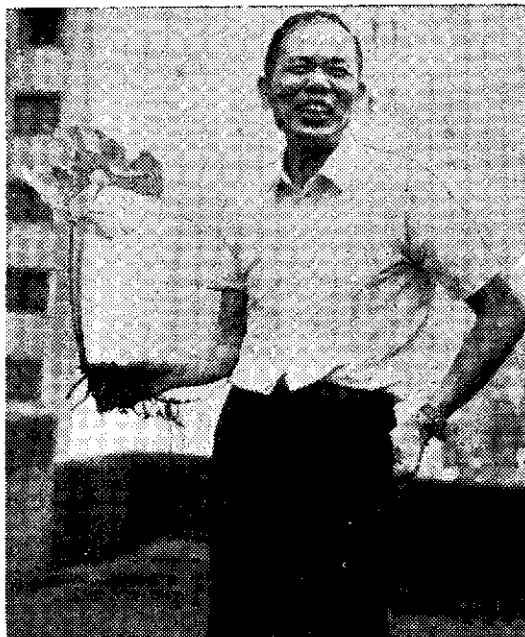
本文作者介紹款冬

種植時期為三、四月，利用地下莖繁殖。將地下莖分為二、三節，作為一株，繁殖倍數約三、五倍。栽植後須灌水覆草，以免土壤乾燥。