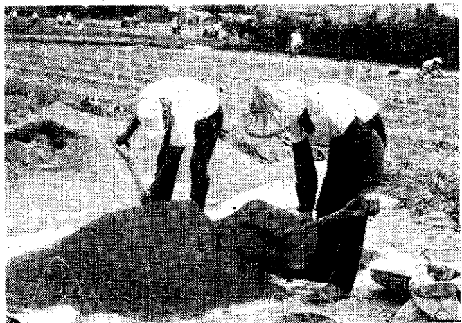
床土要與化學肥料混合均勻