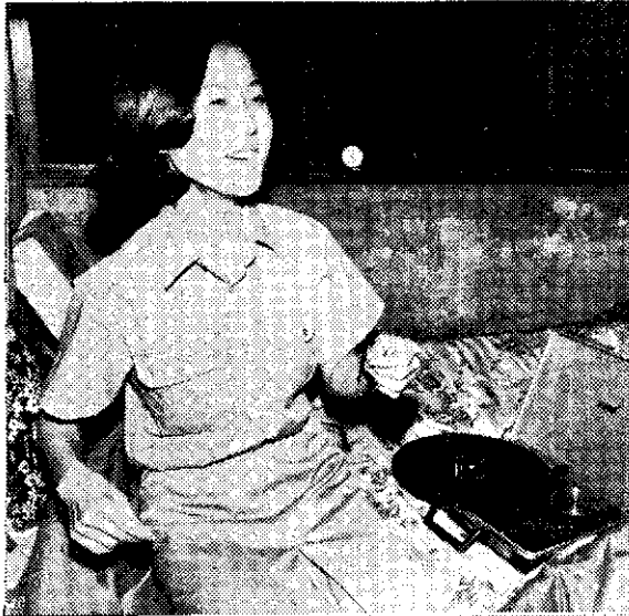
買了新唱片，聽着多高興！