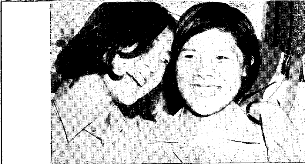
和同學在一起，笑口常開。