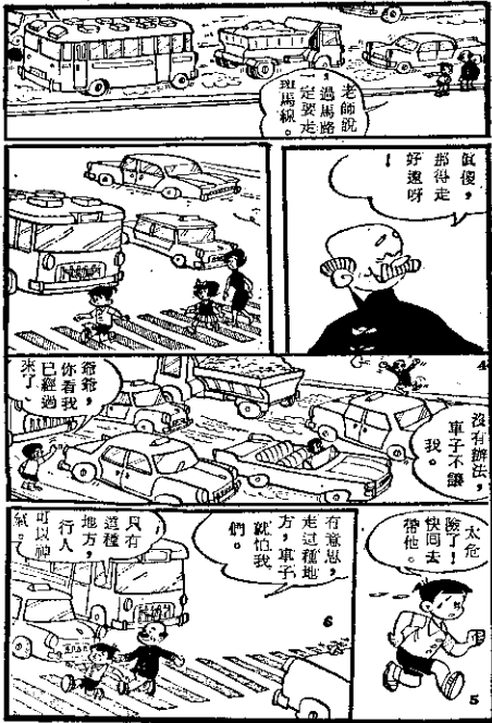
過馬路要走斑馬線 (劉興欽)