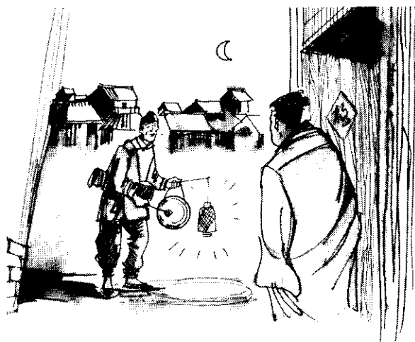
純方哥按着節拍，有板有眼的敲梆打鑼。