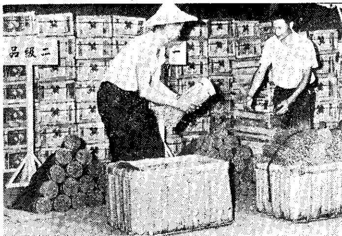
漢湖果菜市場蔬菜共同運銷分級包裝 (蕭益美)

封面說明：台中農業改良場哈密瓜育種試驗。哈密瓜是我國新疆省的名產，台中農業改良場計畫育成適合台灣栽培的品種。