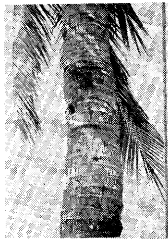
犀角金龜為害樹幹

可可椰子螟虫及可可椰子小象鼻虫，前者以幼虫為害幼嫩花序及果實，影響果實發育並導致嚴重落果。後者的幼虫，破壞葉柄內部組織，造成葉柄折斷，嚴重影響生育。