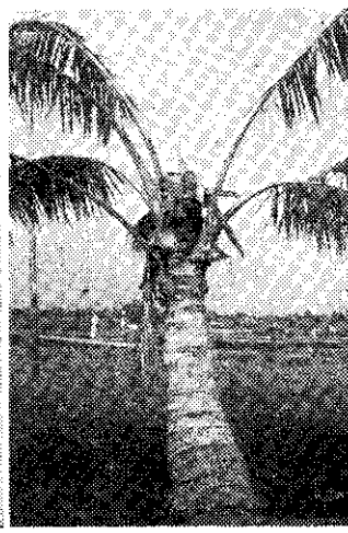
犀角金龜為害頂芽後頂芽枯死